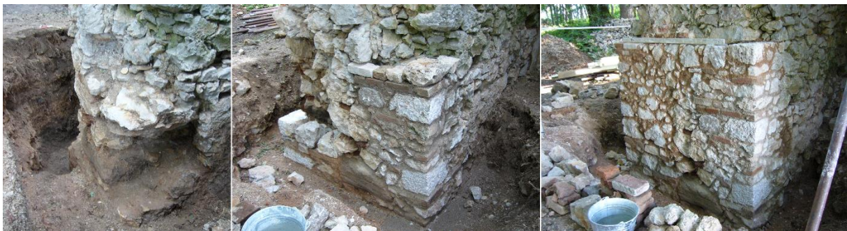
Špaleta prejazdu pri odkrývaní a jej rekonštrukcia.