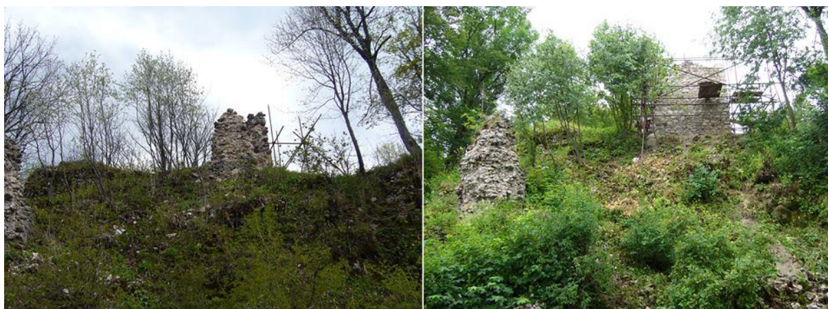
Pohľad od západu.