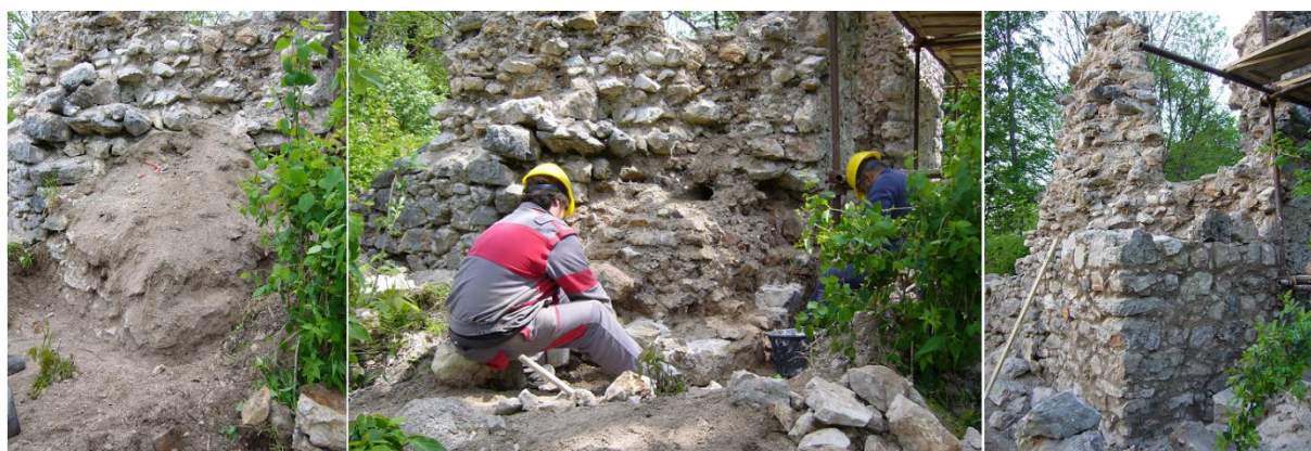
Priebeh prác na rekonštrukcii juhozápadného nárožia.

Objekt Hlavnej veže bol v kritickom havarijnom stave a pravidelne dochádzalo k úbytkom muriva. Hrozilo, že zanikne najvýraznejšia časť objektu, jeho juhovýchodné nárožie. Práve preto sa tento zásah ocitol medzi prioritami minulej sezóny. Začali sme čiastočnou rekonštrukciou už prakticky neexistujúceho juhozápadného nárožia, ktoré má dnes výšku štyri metre. Pokračovalo sa stabilizáciou východnej steny a zmenšením vypadnutého otvoru v južnej stene objektu. Zároveň sa priebežne plošne škárovalo. V interiéri veže prakticky neexistovalo lícne murivo, pri jeho dopĺňaní sa rekonštruovali otvory po vyhnitých trámoch bývalého podlažia. V závere sa práce sústredili na preskladanie korún a rekonštrukciu celého juhovýchodného nárožia. Napokon dostali koruny muriva ochrannú vegetačnú vrstvu tvorenú suchomilnou trávou a rozchodníkmi.