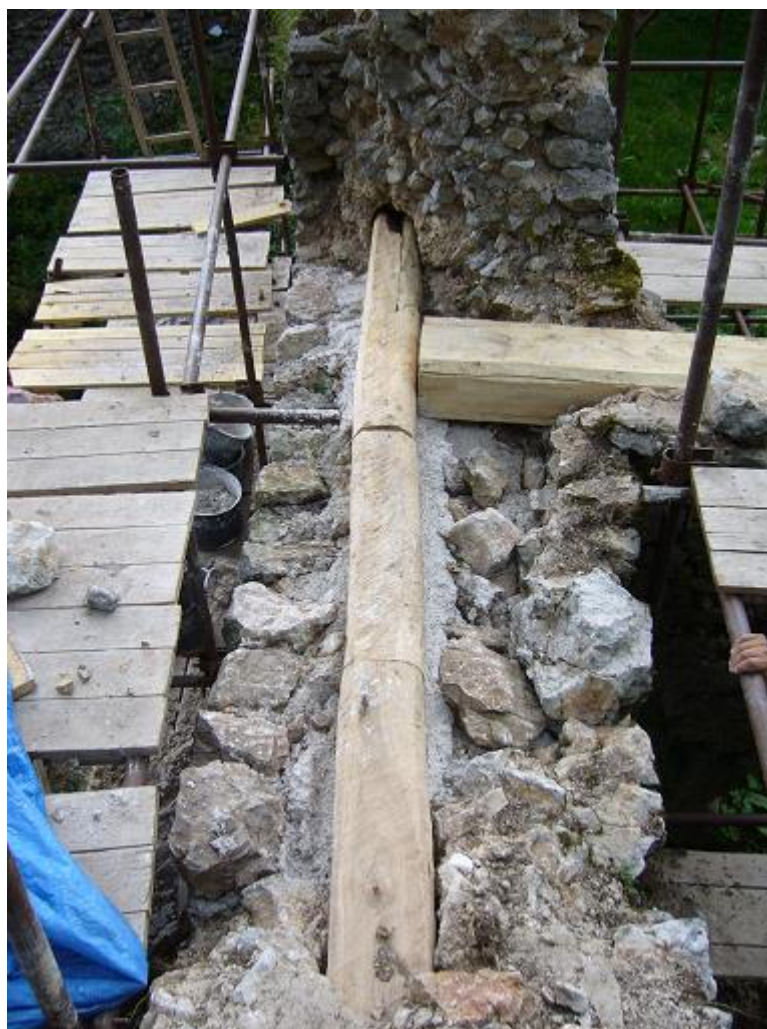
Osadený stužovací trám.