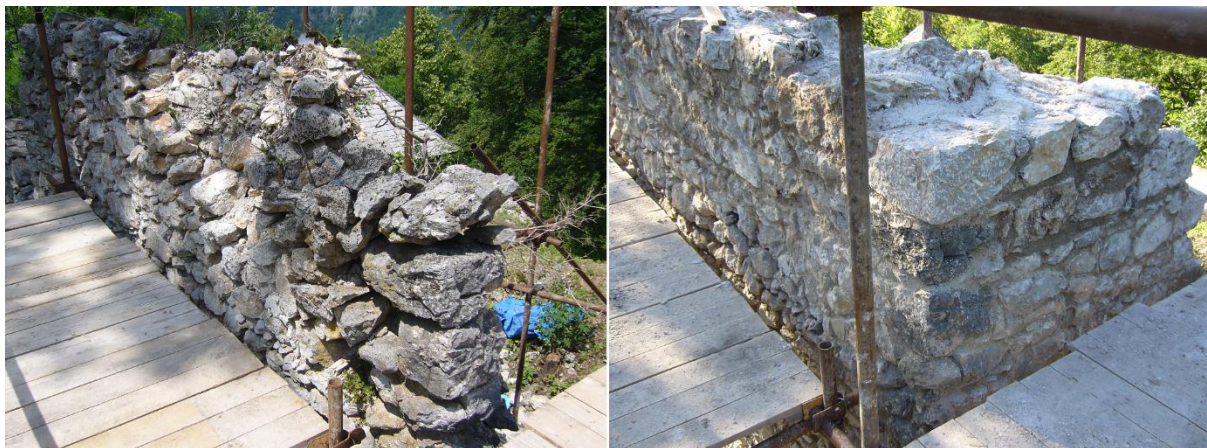
Koruna a juhovýchodné nárožie veže pred a po zásahu.