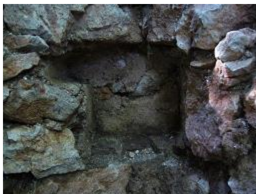
Odtlačok schodu a nástupnice.