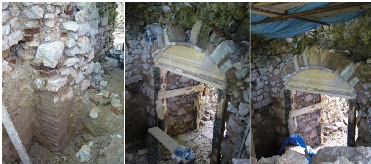
Rekonštrukcia špalety a klenby vo vstupe do schodiskovej časti.