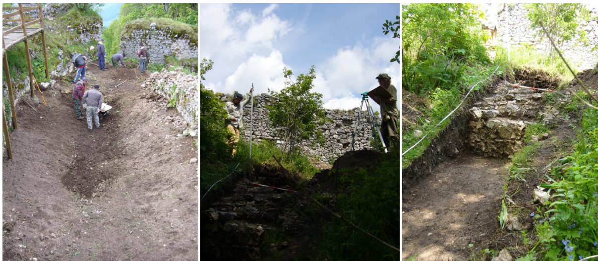
Predbežné chystanie terénu na odvodnenie a dokumentácia archeologických sond.