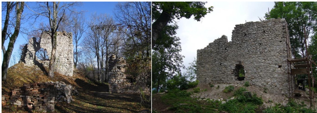
Stav Hlavnej veže pred a po zásahu pri pohľade z južnej strany.