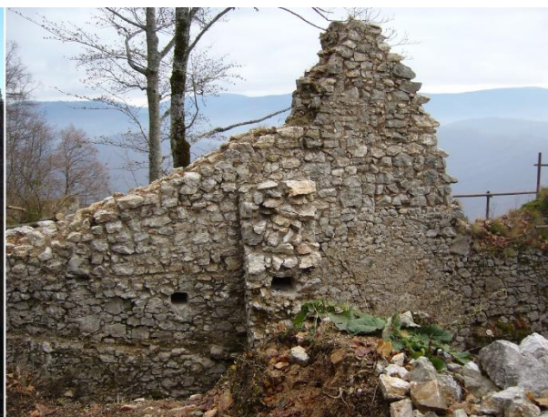
Stav po zásahu 2016