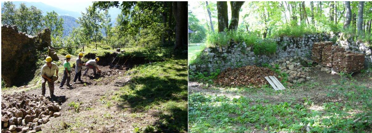
Triedenie a uskladnenie pôvodného stavebného materiálu.

Keďže v minulých sezónach sa realizovali mnohé stavebné zásahy, zásoba roztriedeného kameňa začala byť nedostatočná. Preto sme boli nútení získavať vhodné kamene zo sutinových závalov v rôznych častiach hradu. Takto získaný materiál sa triedil a ukladal na miesta, kde bude pripravený k ďalšiemu použitiu.