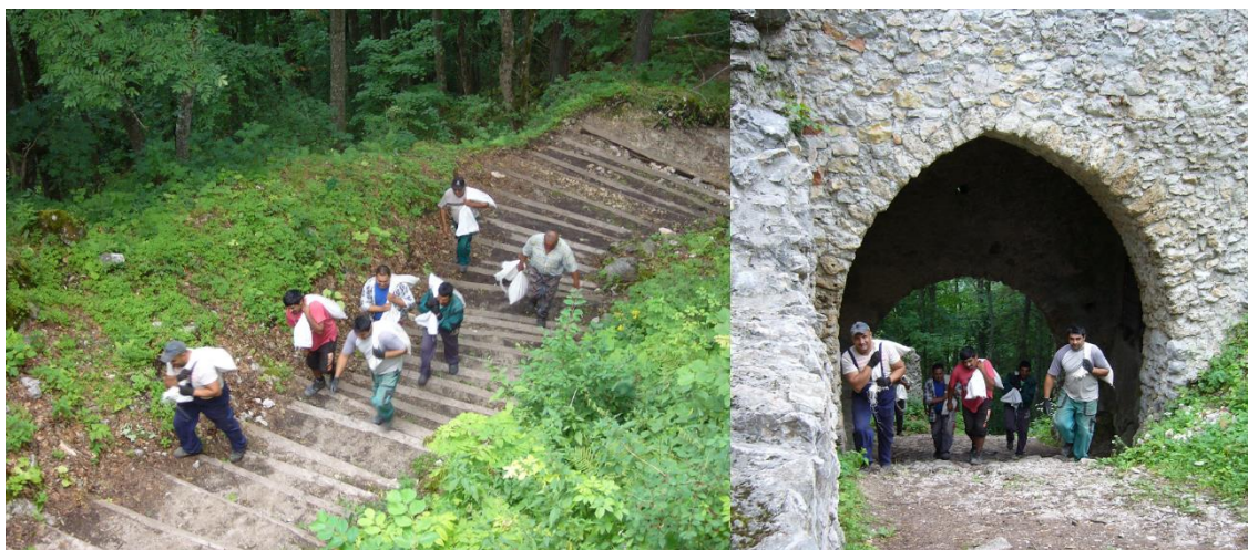
Vynášanie kameniva a kusového vápna vo vreciach hradnými zamestnancami.

V sezóne 2016 pribudlo vynášanie dreva dosiek a trámov, ktoré sú potrebné pre výrobu lešenárskych podlážok a pre výdrevu klenieb, ktoré sa budú rekonštruovať na prejazde Hlavného paláca.