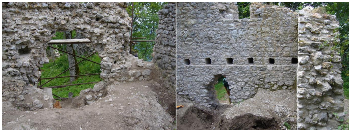
Interiér veže v priebehu prác.