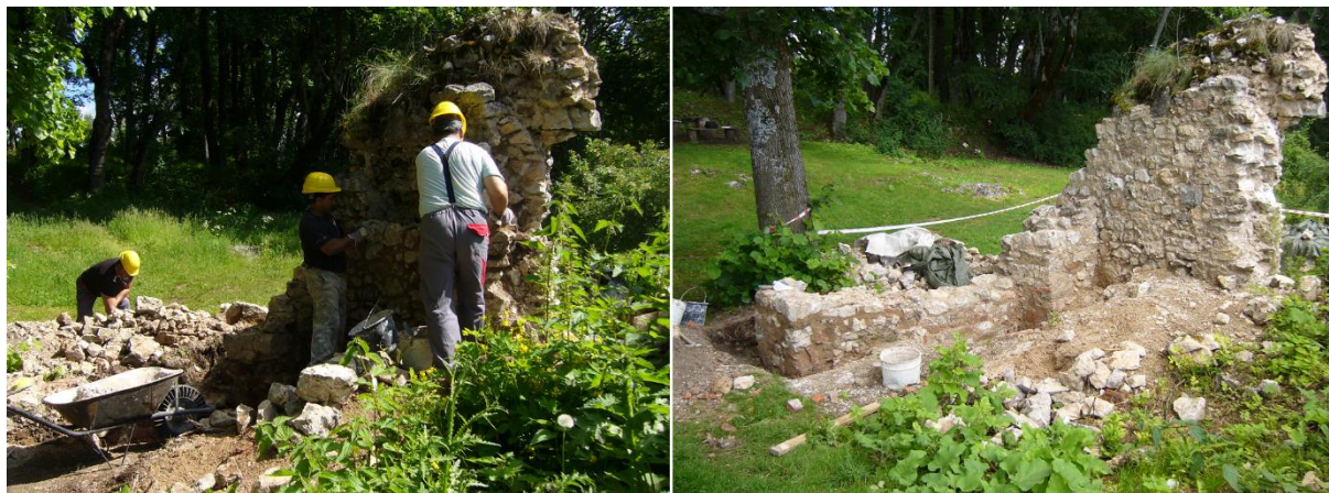
Priebeh prác pri konzervácii priečky a bývalej fasády paláca.