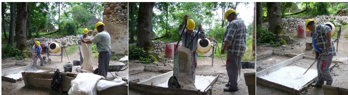
Príprava tzv. horúcej kopy

V roku 2016 sme mali stavebné zázemie pri Dome veliteľa, ktoré je od studne vzdialené cca 200 m. Vodu sme čerpali zo studne vysokotlakým čerpadlom a taktiež sme zakúpili hadice, cez ktoré bolo možné dostať vodu, s jednou medzistanicou, až k stavebnému zázemiu.