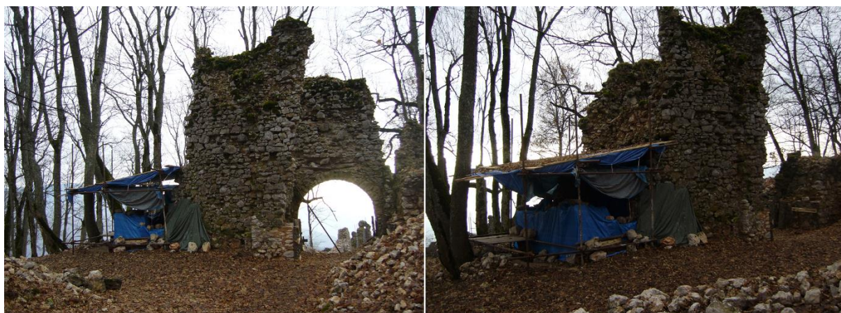
Zakonzervované časti prejazdu boli zazimované. Objekt čaká 2. etapa, konzervačných zásahov a statického zabezpečenia.