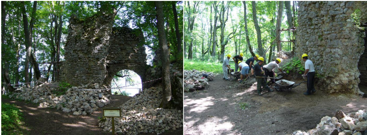
Stav pred zásahom a priebeh začisťovacích prác.

Táto časť Hlavného paláca je z dlhodobého hľadiska v havarijnom stave a svojím umiestnením ohrozuje návštevníkov pamiatky. Už minulých rokoch bola zakonzervovaná klenba východnej časti prejazdu. V sezóne 2016 sme sa sústredili na prízemnú časť prejazdu, kde bolo najskôr nutné po začistení terénu sanovať neexistujúce časti špaliet, aby bolo v druhej etape možné rekonštruovať zaniknuté klenby a podoprieť torzo kaplnky. Klenba do schodiskovej prístavby bola rekonštruovaná v plnom rozsahu. K objektu je nutné pristupovať veľmi citlivo z dôvodu zachovania mnohých stavebných detailov (otlačky po drevených stavebných konštrukciách, torzá pôvodných omietok). Zakonzervovali sme schodiskovú časť prejazdu, kde sa nachádzajú otlačky po drevenom vretenovitom schodisku a torzo okna pre osvetlenie schodiska. Tým sme zakončili prvú etapu konzervácie a čiastočnej rekonštrukcie prístavby.