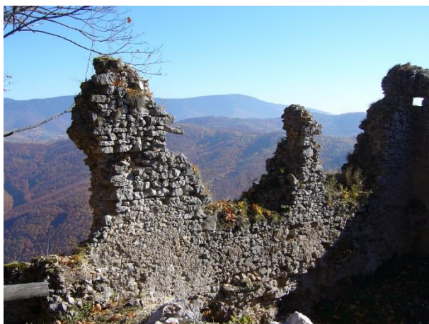
Stav pred zásahom 2015

Práce začali konzervovaním múrikov bývalej fasády, ktoré boli odhalené archeologickým výskumom v roku 2014. Od vtedy boli provizórne chránené geotextíliou a nasucho vyskladanou vrstvou kameňa. Zakonzervované boli aj niektoré z vnútorných priečok paláca. Náročnejší bol zásah na východnej stene, kde hrozilo zrútenie pomerne veľkej časti pôvodného muriva. Zásah bol o to komplikovanejší, že bolo treba postaviť lešenie a pracovať v pomerne extrémne situovanom svahu na hrane hradného brala. Takisto sme tradičným tesárskym spôsobom vyrobili stužovacie trámy, ktoré boli následne osadené na svoje pôvodné miesto. Pri všetkých zásahoch na Koháryho paláci boli plošne preškárované príslušné úseky muriva.