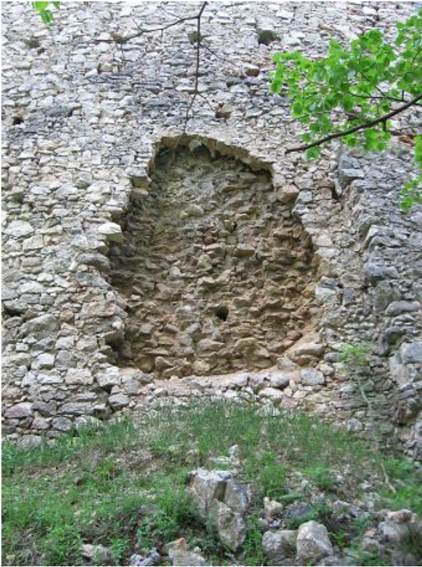
Stav pred zásahom