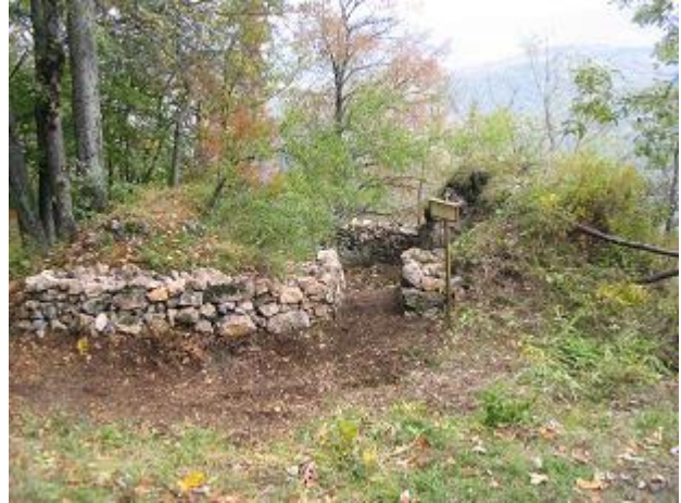
Stav po zásahu