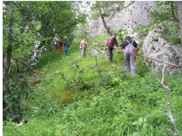
Vynášanie lešenia – 2. časť

Vynášania lešenia video záznam: https://www.youtube.com/watch?v=IK8Aaea0COw