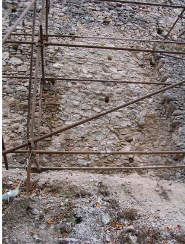
Stav po vymurovaní pred škárovaním a injektážou