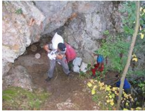
- chodník popod skalu, neprístupný turistom