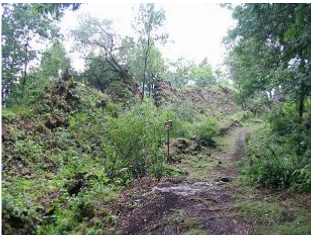
Stav pred zásahom