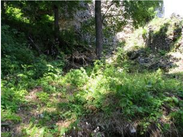
Stav počas zásahu