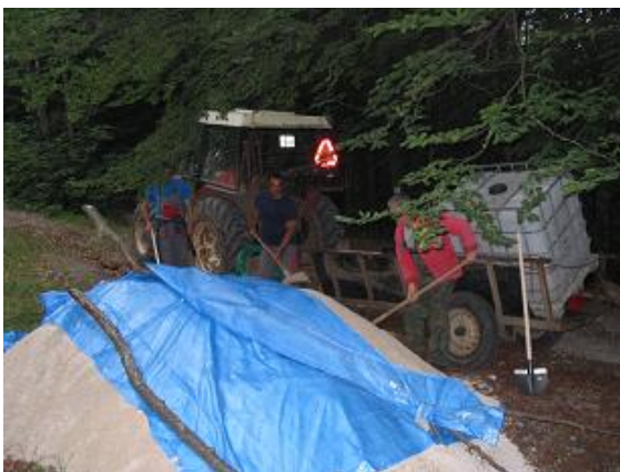
Kopa piesku 1,2 km od hradu

Hrad Muráň je špecifický svojou polohou, rozlohou a nedostupnosťou terénu pre akékoľvek mobilné prostriedky. Všetko náradie, stavebné stroje, lešenie a všetok materiál sa vynáša manuálne v náročnom teréne 400 – 500 m. Na úseku cca 250 m nie je možné použiť ani fúrik. V roku 2013 sa okrem potrebného náradia, lešenia (cca m 2 ), vojenského stanu, miešačky, injektážneho stroja, 1000 l kontajnerov a sudov na vodu vyneslo na hrad 11,5 t (cca 6,5 m 3 ) piesku a 1,5 t nehaseného kusového vápna postupne a to vo vreciach na chrboch. Ručná manipulácia s pieskom, ktorý nebolo možné nákladným autom doviesť pod hrad (bol zložený 1,2 km od hradu), sa s 3-násobila, pribudlo nakladanie a vykladanie piesku z vlečky traktora.