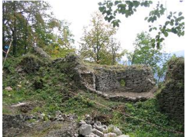
Stav po zásahu