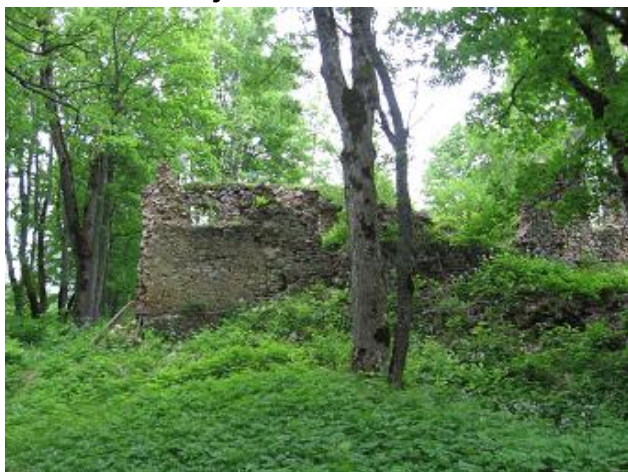
Stav pred výskumom