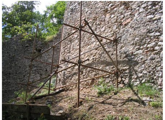
Stav po zásahu