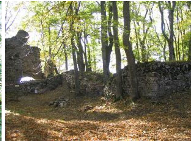
Stav po zásahu