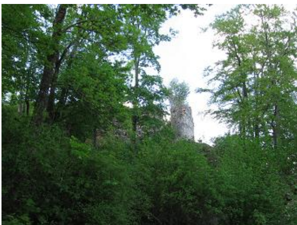
Stav pred zásahom

ktoré sa nachádzalo za Studňou pod múrom Vážnice (v plániku medzi č. 23 a 22). Práce pozostávali z odstránenia náletovej vegetácie a vyklčovania všetkých pňov, úprava podložia zásypom z menej kvalitnej sute z archeologického výskumu Domu veliteľa (v plániku č. 12).