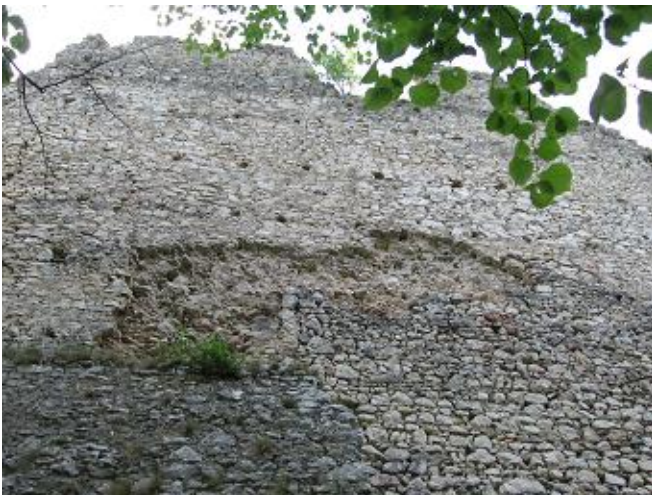
Stav pred zásahom