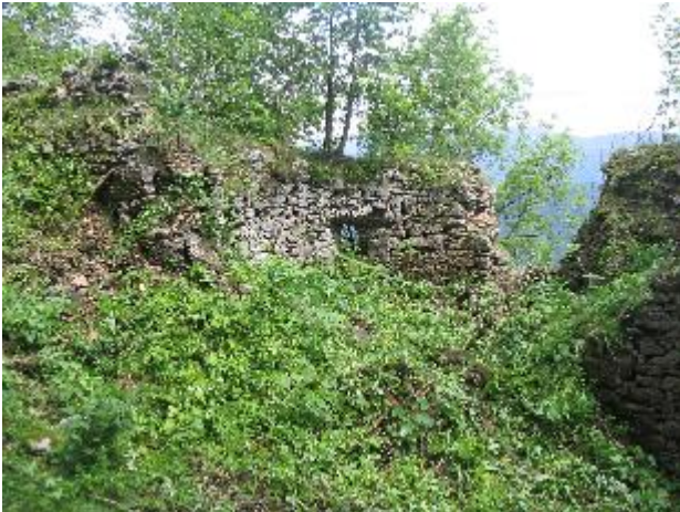
Stav pred zásahom