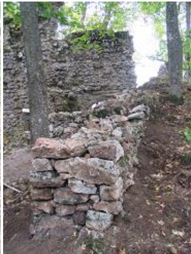
Stav po zásahu