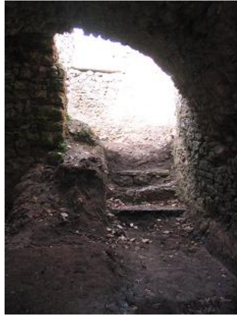
Stav po zasypaní sond a objavených múrov a po úprave terénu, schodíky sú provizórne