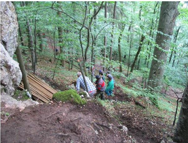
Vynášanie lešenia – 1. časť