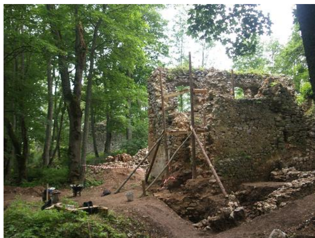
Stav počas výskumu