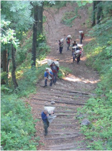
- prístupový chodník na hrad

Na vynášanie piesku, vápna a náradia využívali hradný zamestnanci dve trasy: