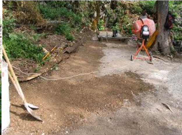
Stav po zásahu