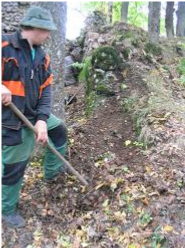
Stav počas zásahu