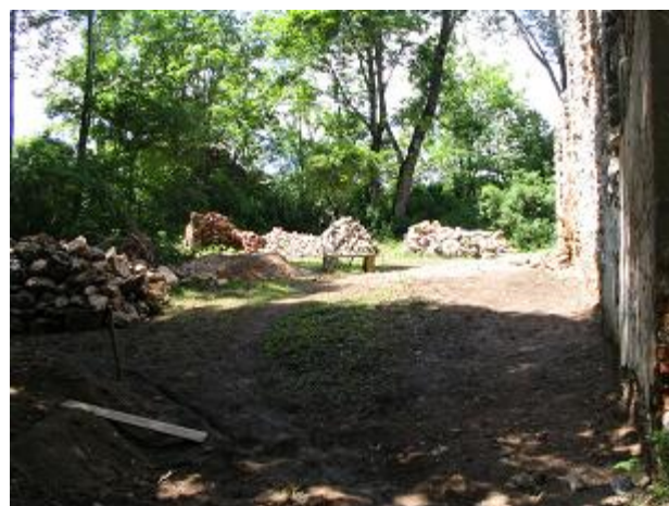
Stav po ukončení výskumu