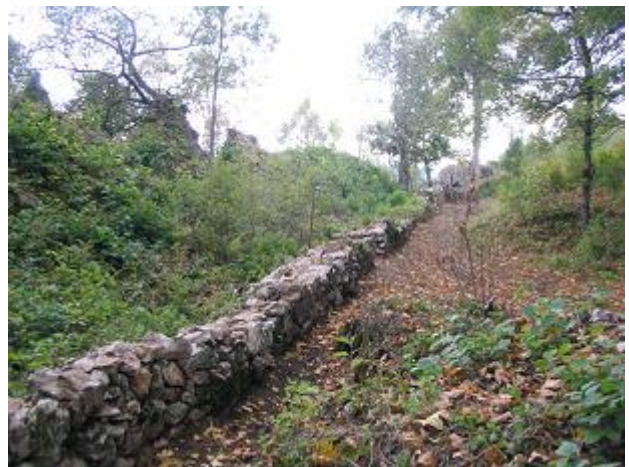
Stav po zásahu