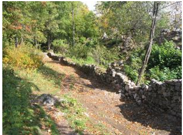
Stav po zásahu