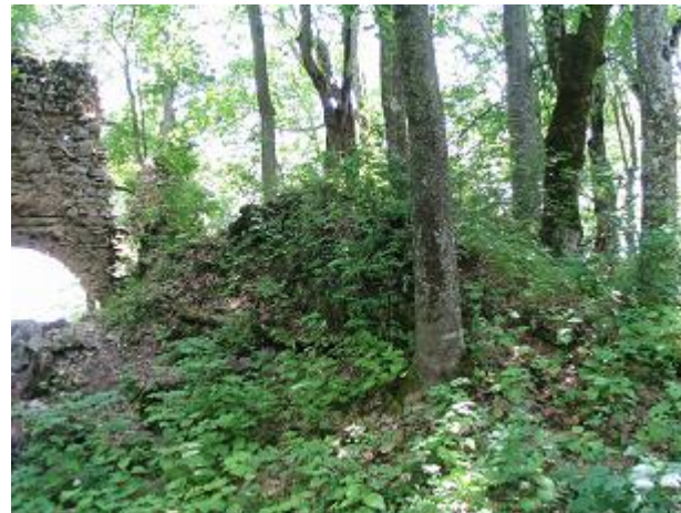
Stav pred zásahom