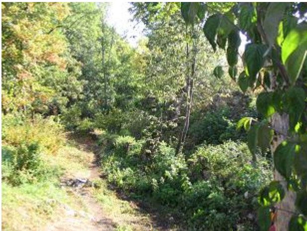
Stav pred zásahom