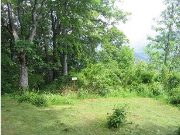
Stav pred zásahom