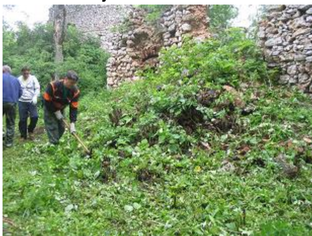
Stav pred výskumom