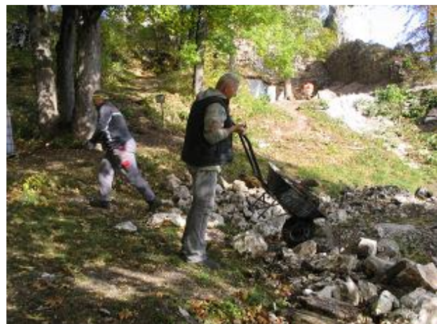
Stav po zásahu / aktivita - čistenie studne