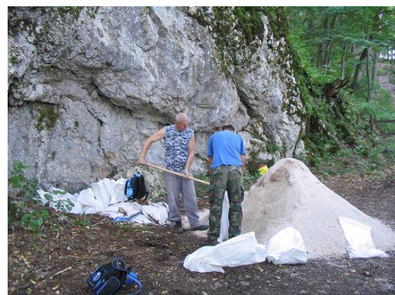
Príprava vriec s pieskom pod hradom