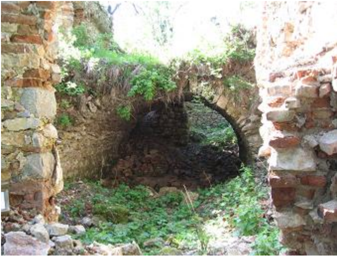
Stav pred výskumom