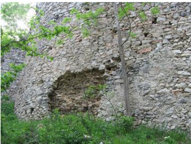
Stav pred zásahom

Realizácia I. etapy statického zabezpečenia na vonkajšej strane východnej hradby bola zameraná na vymurovanie kaverien a v rámci možnosti vyplnenie plášťového odtrhu. Ďalšie práce pozostávali z hĺbkového škárovania, chemického kotvenia a injektáže plášťového odtrhu v okolí kaverien. Tieto práce boli realizované v spolupráci s hradnými zamestancami a pracovníkmi odbornej firmy.