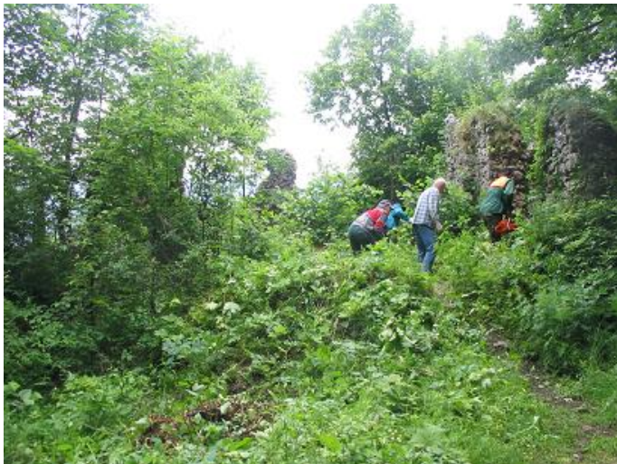
Stav pred zásahom