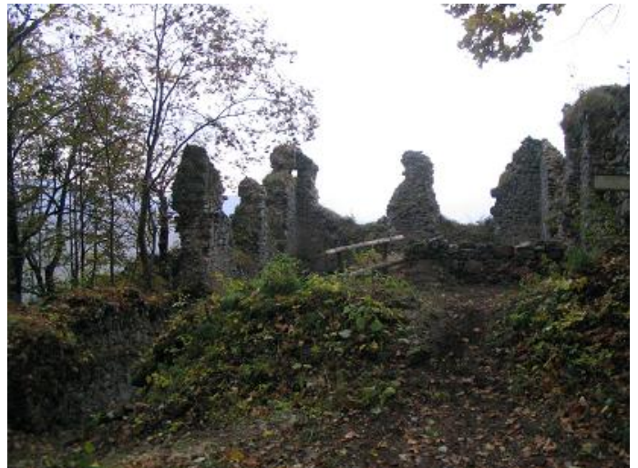
Stav po zásahu