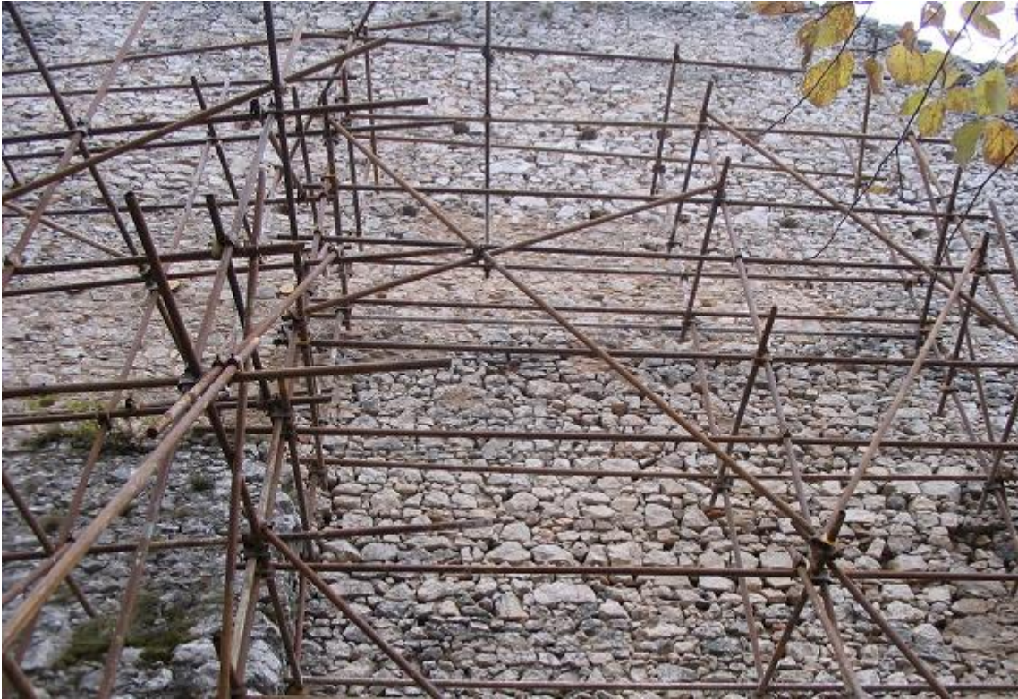
Stav po zásahu