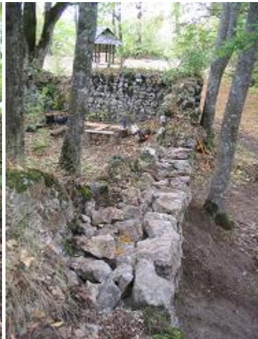
Stav po zásahu