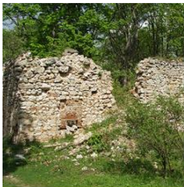
rok 2002