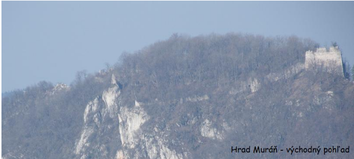
Hrad Muráň - východný pohľad

Obec Muráň, vlastníč NKP Hrad Muráň, sa v roku 2014 po druhý krát zapojila do národného programu „Zapojenie nezamestnaných do obnovy kultúrneho dedičstva“. Na základe pridelenej dotácie z MK SR a v rámci finančnej podpory z Európskeho sociálneho fondu v spolupráci s ÚPSVaR v Revúcej zamestnala pre práce na hrade 17 nezamestnaných na obdobie 6 mesiacov od júla do decembra 2014. Hradný areál tak opäť ožil pracovnou činnosťou s výsledkami, ktoré návštevníci pozitívne hodnotili, pretože okrem konzervačných zásahov sa aktivity sústredili hlavne na revitalizáciu hradného areálu.