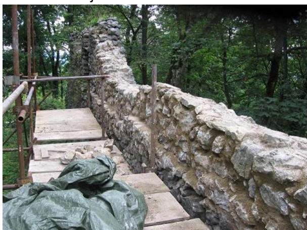
koruna múru a predprseň

V konzervácii pravej časti múru, kde sa predpokladá prítomnosť strielne sa nemohlo pokračovať kvôli stromu chráneného druhu v zmysle vyhlášky o ochrane prírody – jarabine Hazslinszkeho. Pracovníci Správy NP Muránska planina nám až ku koncu murárskej sezóny navrhli/povolili možné zásahy do koreňového systému, preto chceme túto časť hradby obnoviť čo najskôr – zámer 2015.