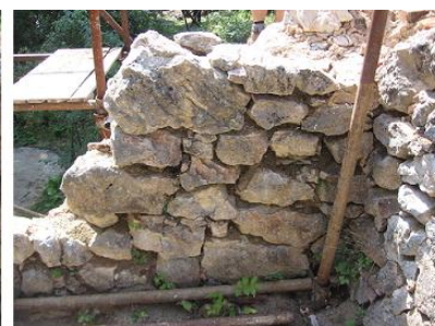
stav pred rozoberaním uvoľneného muriva