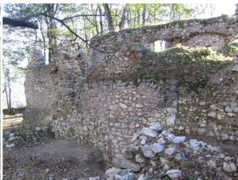
po rekonštrukcii špaliet, prahu a schodov, otvor zamurovaný podľa PD