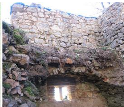
po zásahu - interiér