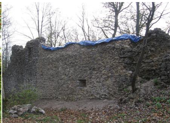
hradba po zásahu 2014

V konzervácii pravej časti múru, kde sa predpokladá prítomnosť strielne sa nemohlo pokračovať kvôli stromu chráneného druhu v zmysle vyhlášky o ochrane prírody – jarabine Hazslinszkeho. Pracovníci Správy NP Muránska planina nám až ku koncu murárskej sezóny navrhli/povolili možné zásahy do koreňového systému, preto chceme túto časť hradby obnoviť čo najskôr – zámer 2015.