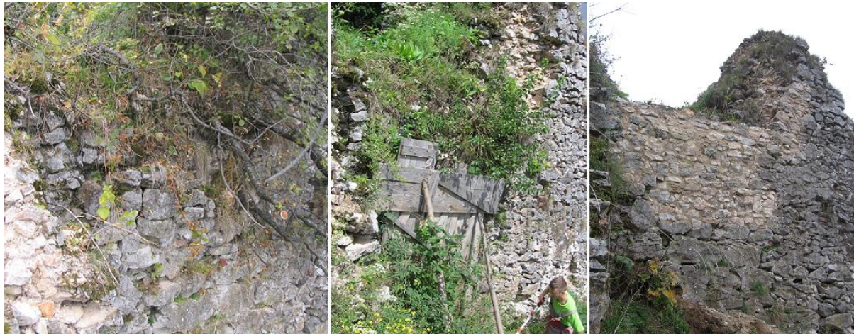
2013 pred zabezpečením

Fixácia uvoľneného lícneho muriva okrem zakonzervovania slúžila aj na zabezpečenie lícných kameňov pred pádom po strmom svahu ďaleko od hradu.