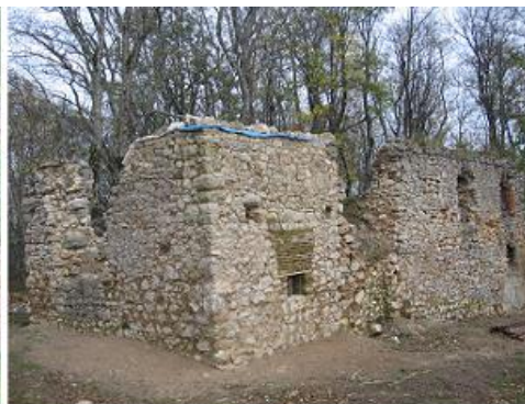
rok 2014 po realizácii