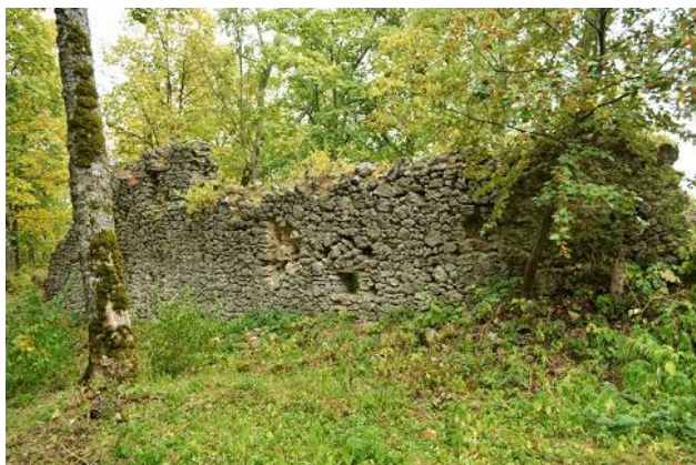
hradba pred zásahom