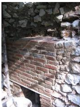
počas zásahu - exteriér