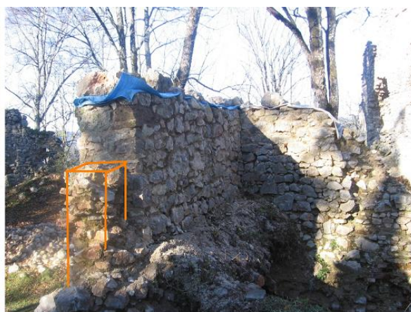
stav po realizácii v roku 2014

Oranžovou farbou je označená konštrukcia staršej stavebnej etapy objektu, ktorá bude pri ďalšej obnove odlíšená primurovaním bez previazania muriva.