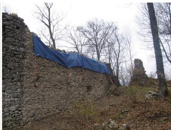
prekrytie koruny a predprsne pred zimou