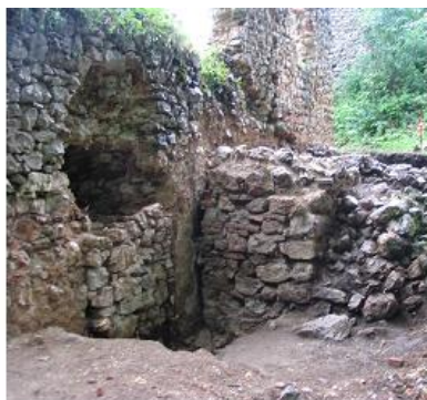
otvor pre zásahom, murivo uvoľnené a prerastené koreňmi