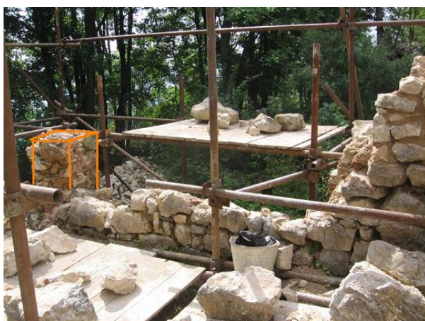
stav po rozobratí uvoľneného muriva