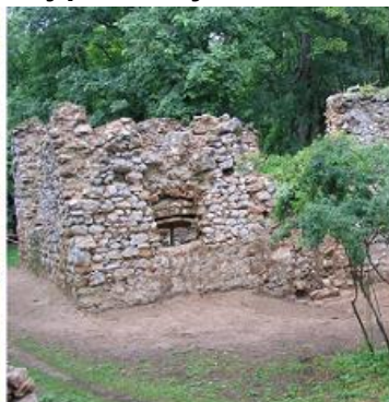
rok 2013 - po archeológii