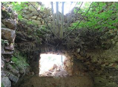
pred zásahom - interiér