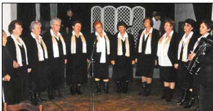
R. 2007 stretnutie 3 generácií v Revúcej