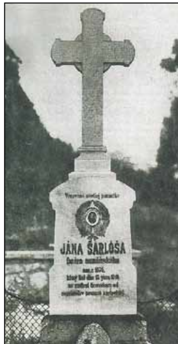
Muránskeho farára podľa dobových svedectiev najprv postrelili a potom zaživa pochovali.

Použitá literatúra: mesačník Extra plus, jún 2012