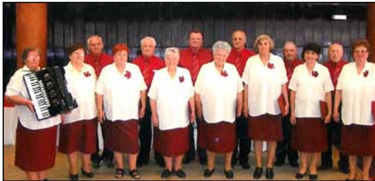
R. 2010 Krajská prehliadka v Štátnom divadle vo Zvolene