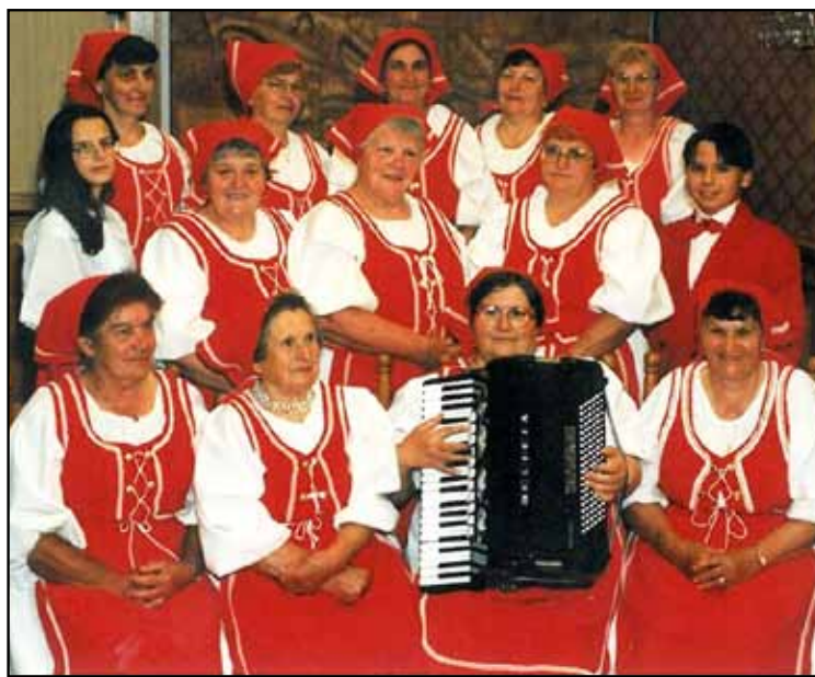
R. 1997 skupina nahrala kazetu