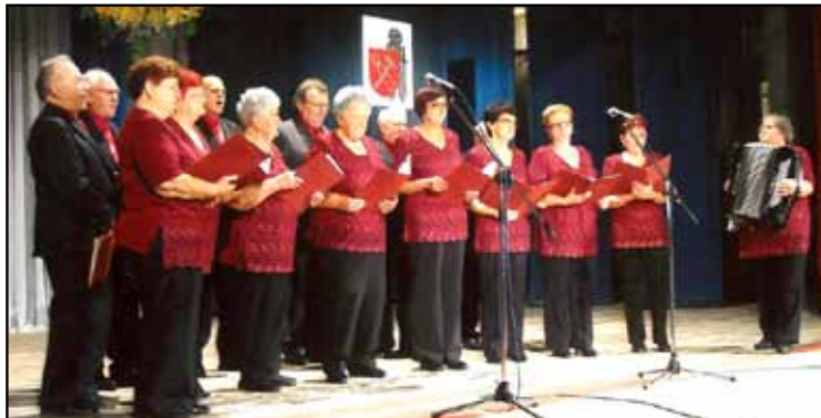
R. 2012 Krajská prehliadka seniorov v Revúcej