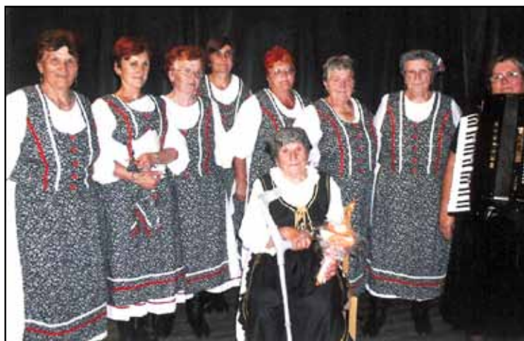
Okresné stretnutie dôchodcov r. 2006 v Muráni