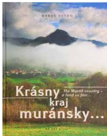
Popularizačná – textovo-obrazová alebo obrazovo-textová monografia mikroregiónu za publikáciu o prírodných krásach